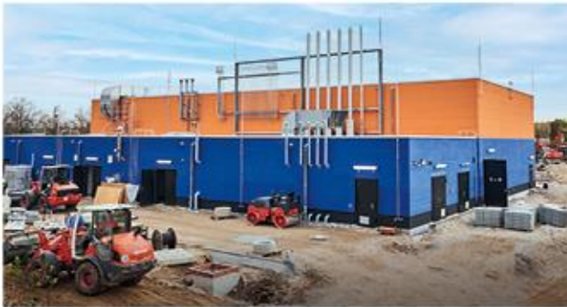
GÜS Buckow, Erneuerung 2020, Investition: 22,5 Mio. €