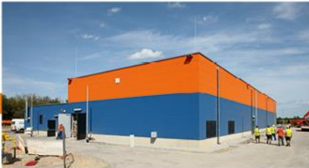
GÜS Waltersdorf, Neubau 2015, Investition: 15 Mio. €